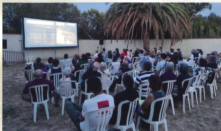
Cinéma en plein air - Top Gun- juillet