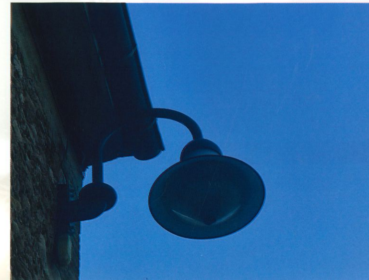
Extinction de l'éclairage public