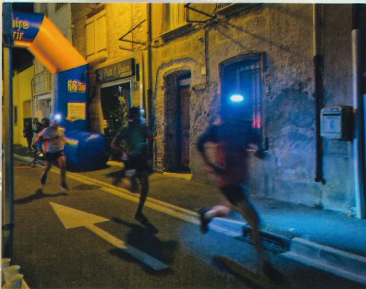
Trail nocturne Ecoparc catalan - décembre