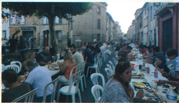
Repas du 14 juillet