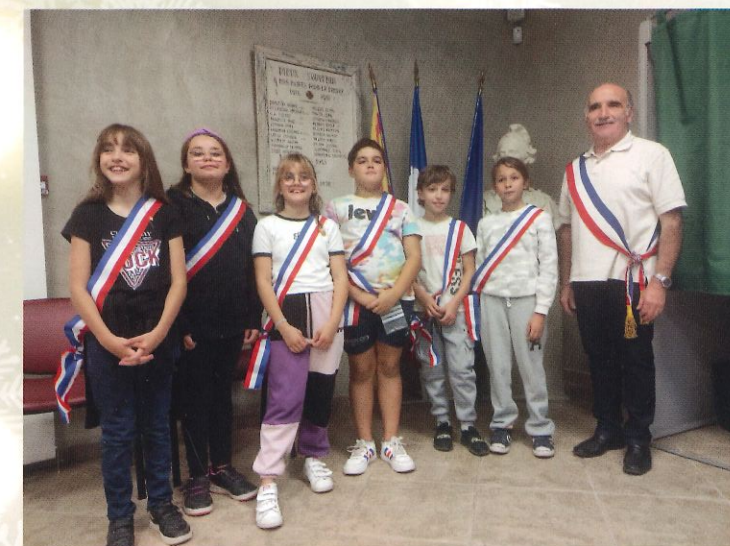
Renouvellement du Conseil Municipal Enfants-octobre