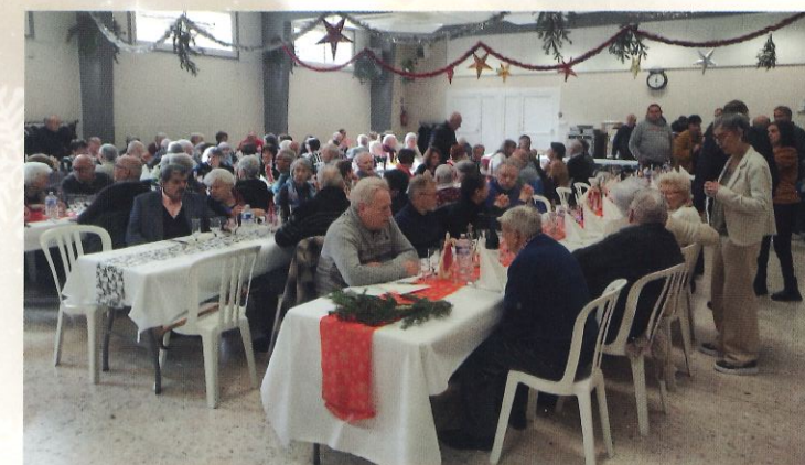
Repas des aînés - décembre