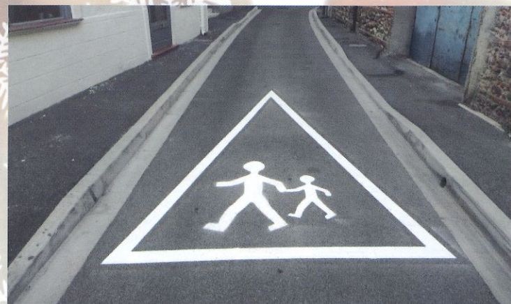
Sécurisation aux abords de l'école