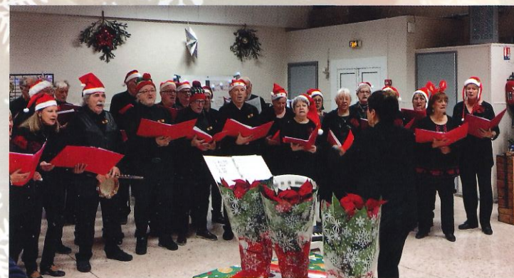
Marché de Noël - décembre