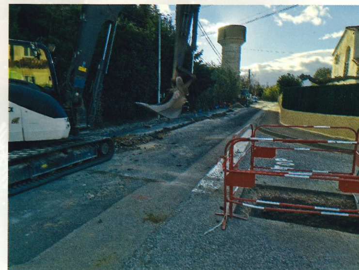
Réhabilitation réseaux rue du moulin