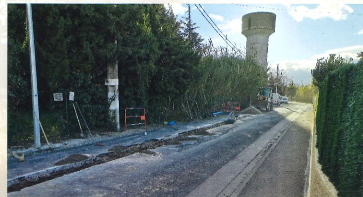
Mise en sécurité chemin Alous