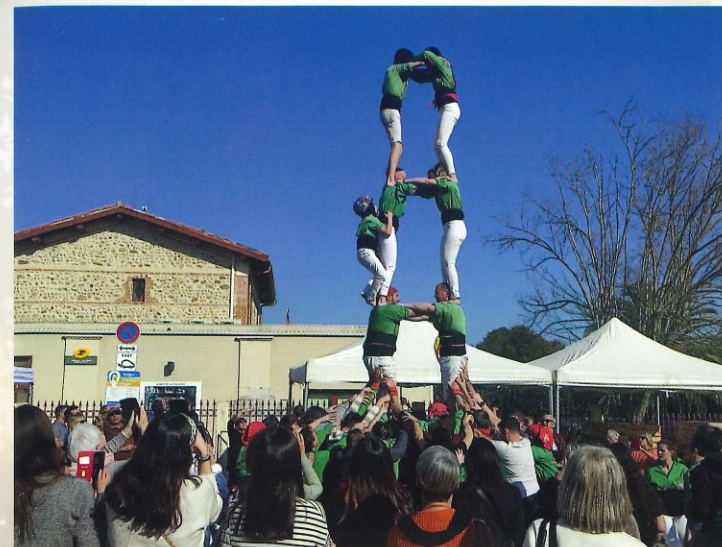
Fête de l'Orange - mars