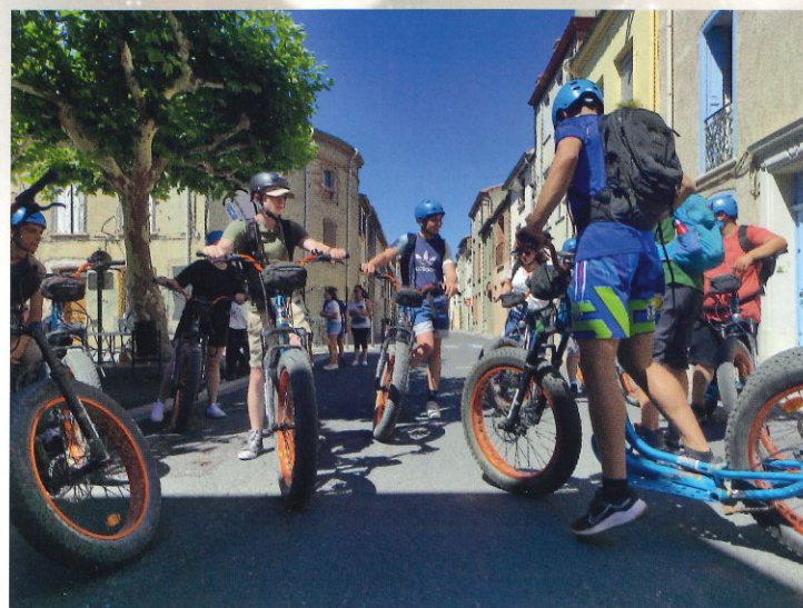
Marche des producteurs-juillet