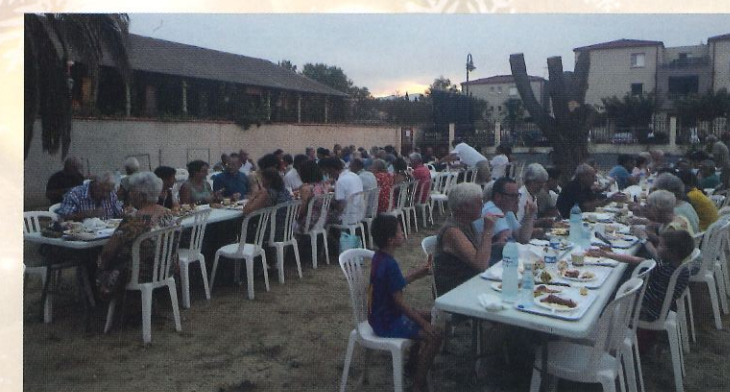
Repas de la fête locale - août