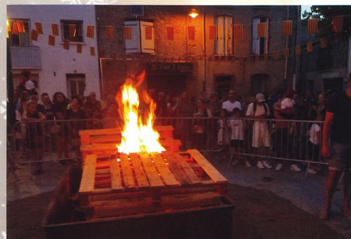
Feux Saint Jean- juin