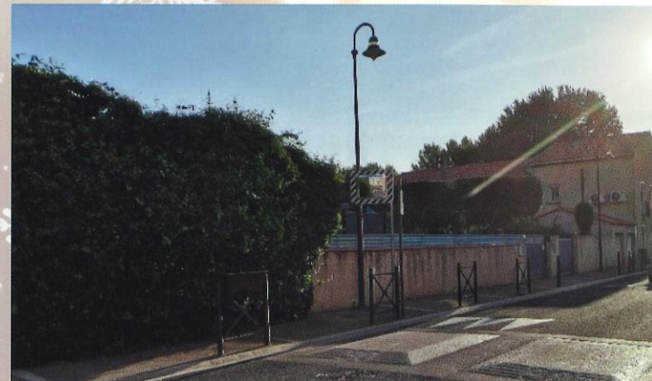
Pose miroir avenue Pont Neuf