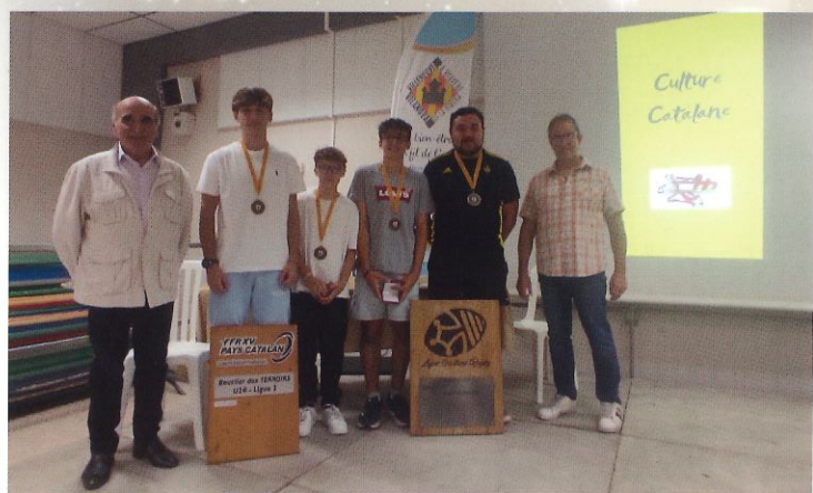
100 % asso - octobre