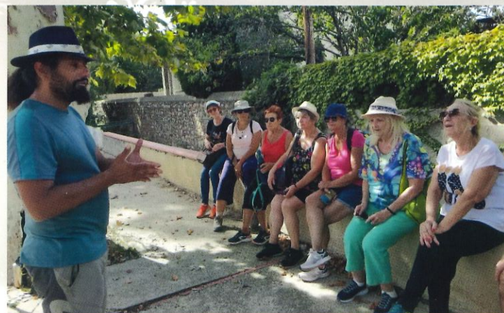
Balade santé séniors Semaine Bleue - octobre