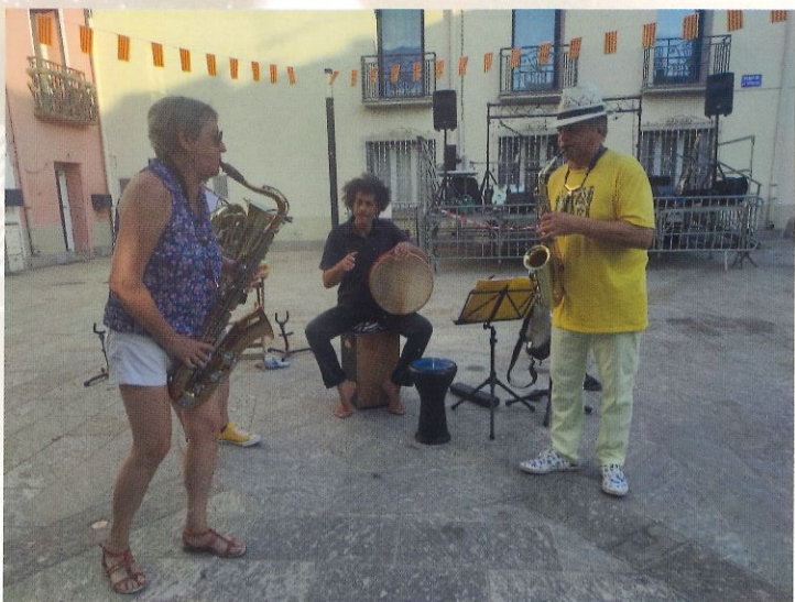
Fête de la musique sur la place