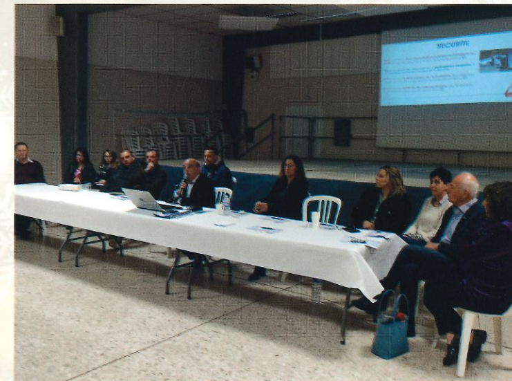
Reunion publique de mi-mandat