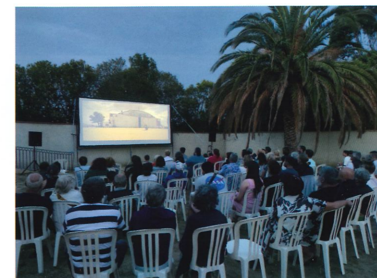
Cinéma en plein air "Top Gun"