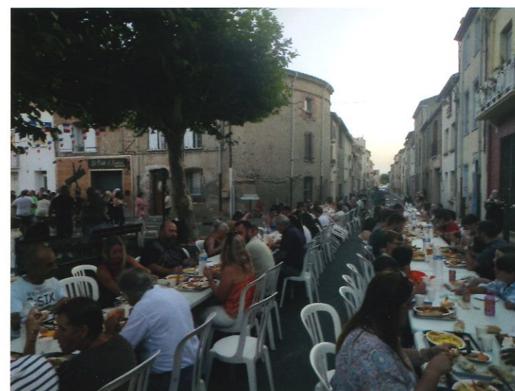
Repas organisé par les Festifs le 14 juillet