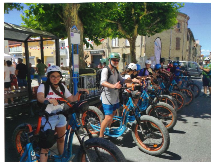
Marché des producteurs balade en trottinette électrique