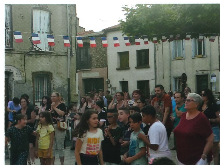
Fête de la musique sur la place