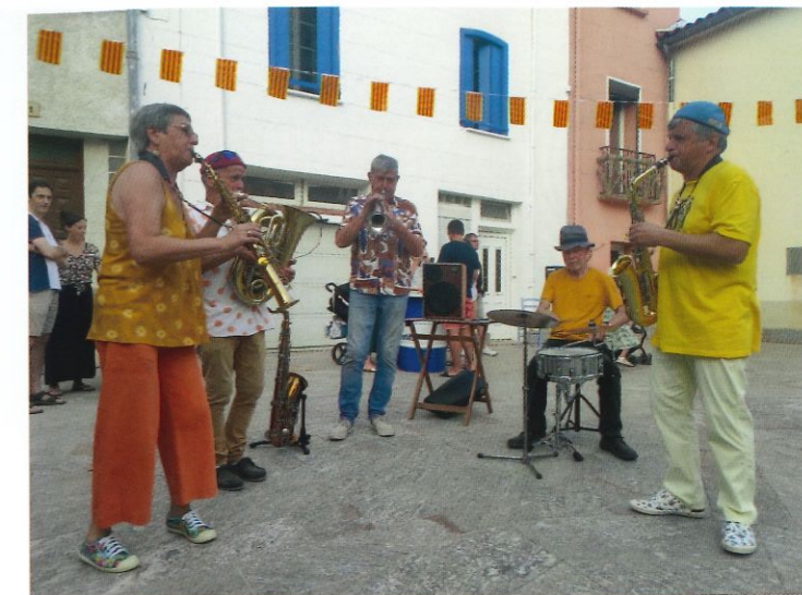
Trio Marguerite - Fête de la musique sur la place