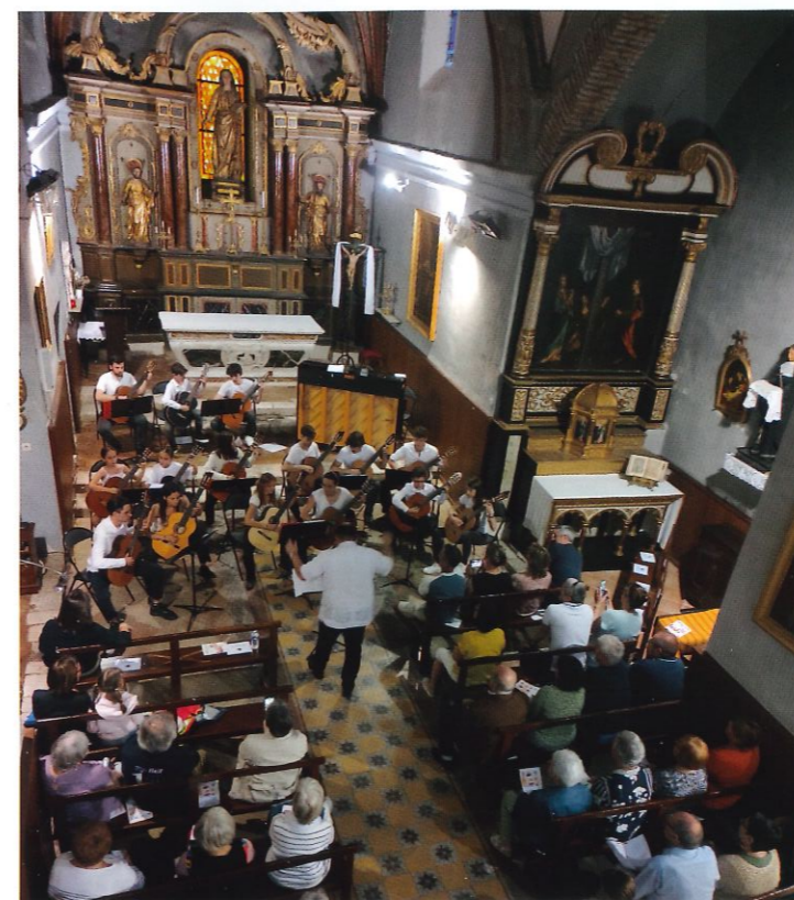
MEMORIA concert des élèves du Conservatoire à l'église