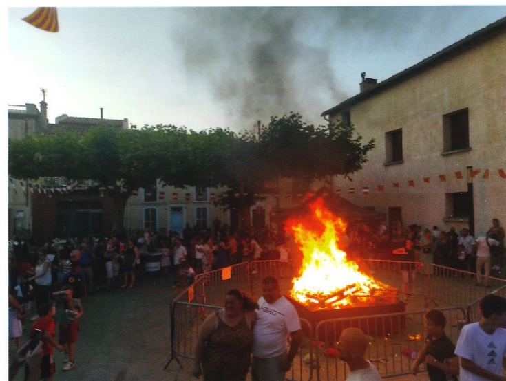
Feux de la Saint Jean