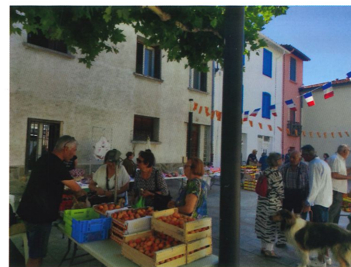
Marché des producteurs sur la place