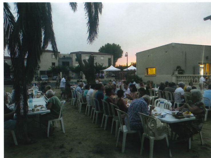
Repas organise par VIA pour la fête locale du 23 aout