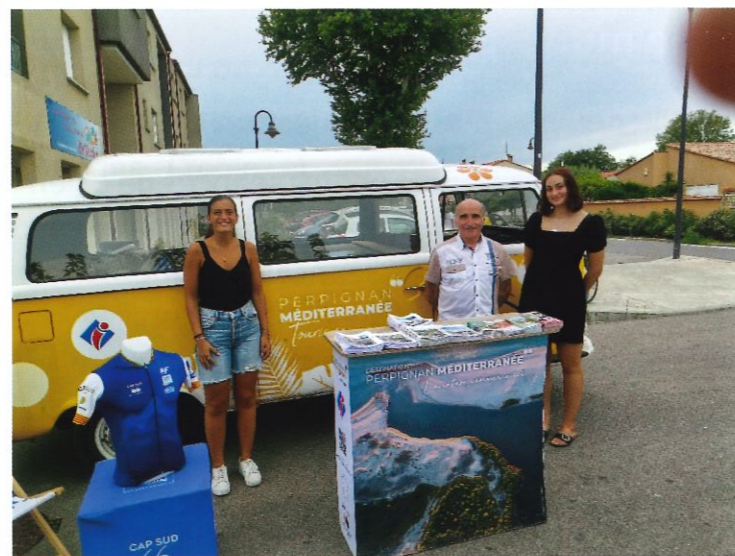
Fête locale du 23 aout