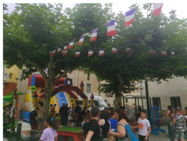
Kermesse de l'ecole sur la place