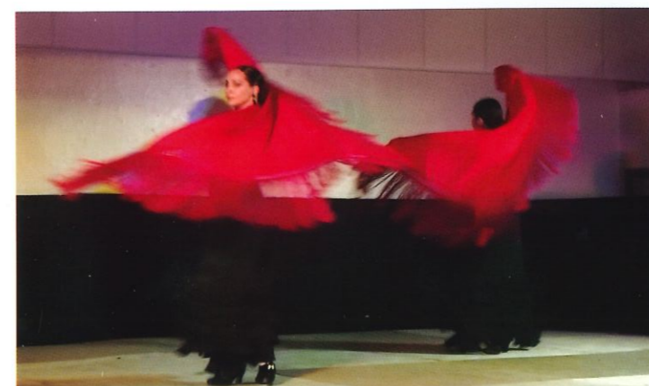
MEMORIA spectacle de danse flamenco