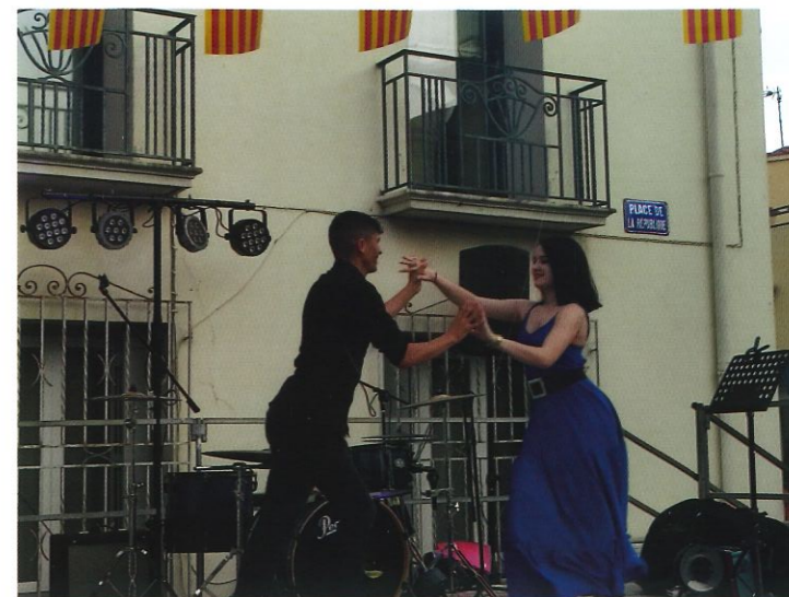
Fête de la musique sur la place