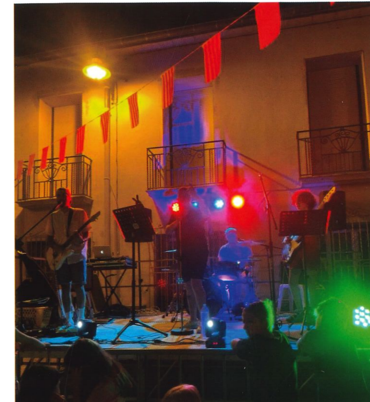
BLAX- 14 JUILLET sur la place organisé par les Féstifs