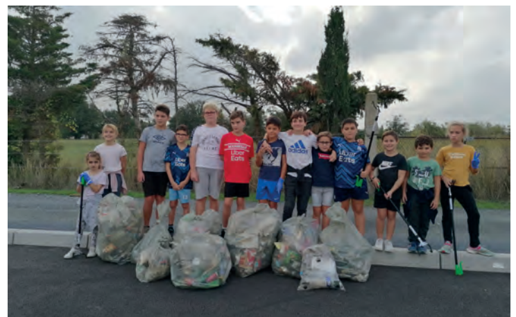
Nettoyons la nature avec les enfants du conseil municipal.