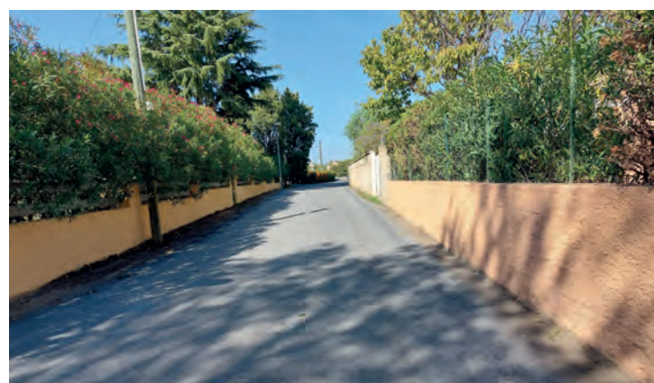
Aménagement de voirie au pont de Fousté