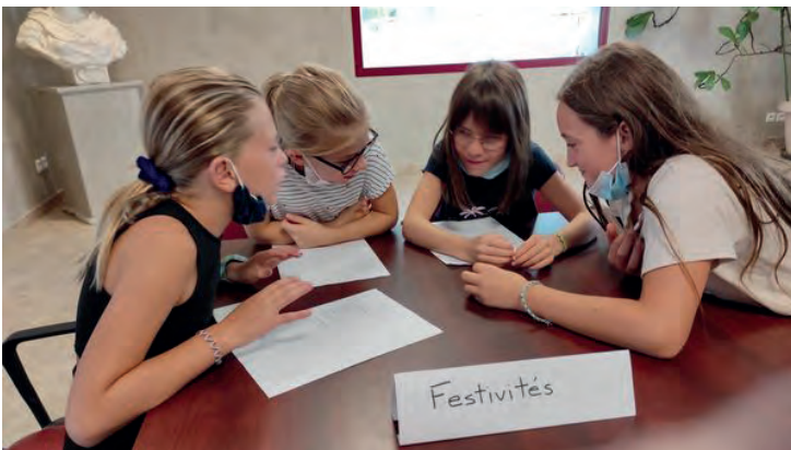
Le conseil municipal des enfants en pleine reflexion