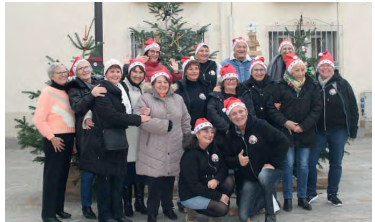
Four Winds Dancers