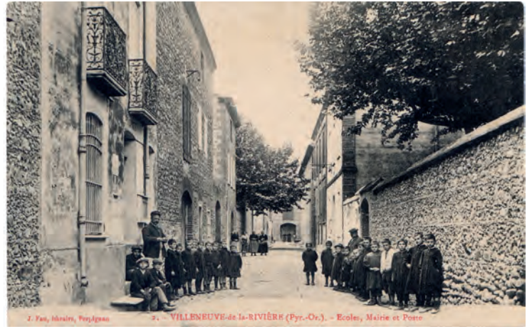
Vue de la rue des écoles