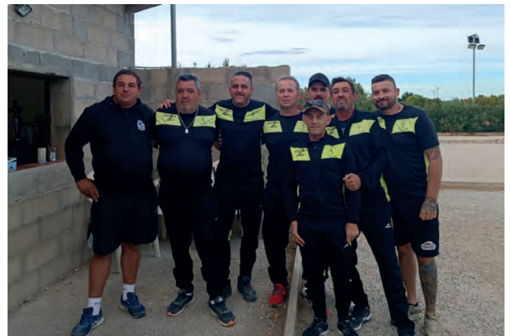
La Boule Villenuevoise