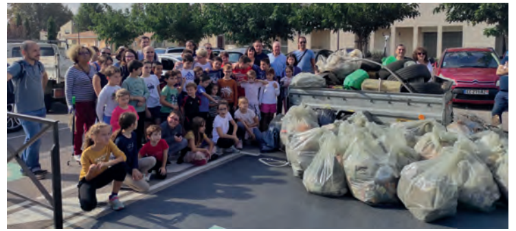
Nettoyons la nature avec les villeneuvois.