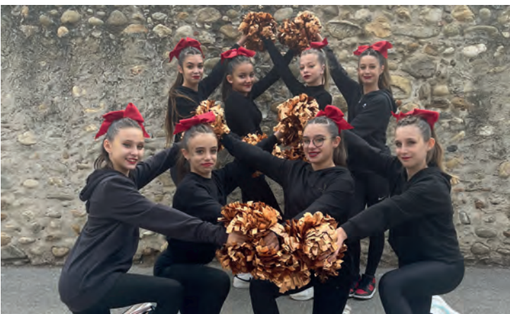
Shiny Flying Stars