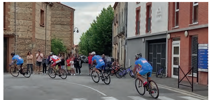
Course cycliste dans les rues de Villeneuve.