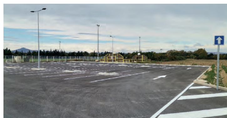
Aménagement parking du stade.