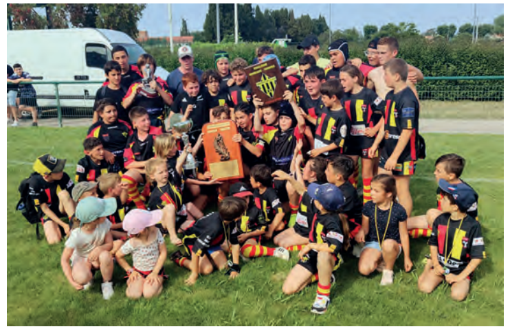
Entente de la Têt