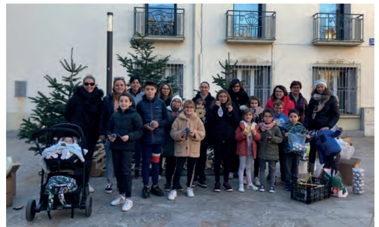
Installation des décorations de Noël.