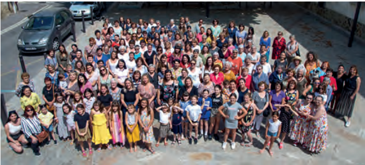
La photo des villeneuvoises