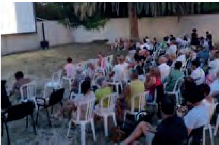
Cinéma en plein air dans les jardins de la mairie