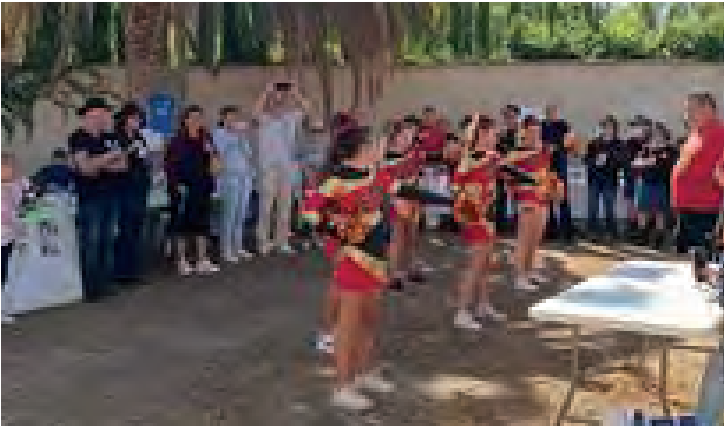
Journee 100% assos en septembre