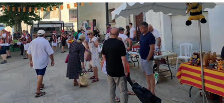
Marché des producteurs et artisans " Art Terre "