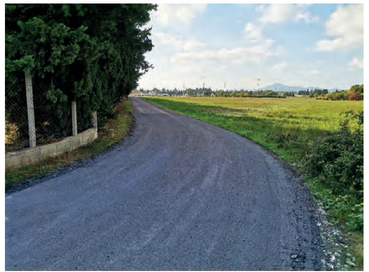
Travaux de voirie camé alous.