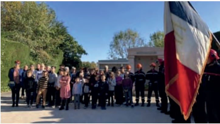
Ceremonie commemorative du 11 novembre