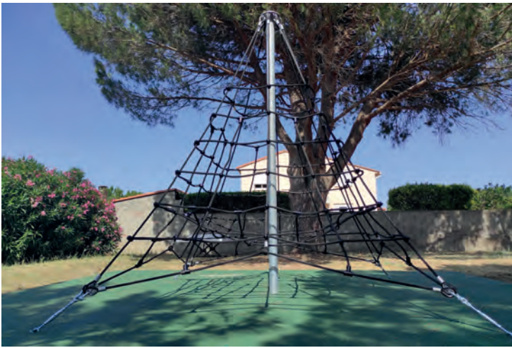
Pose d'un nouveau module à l'aire de jeux pour les enfants.