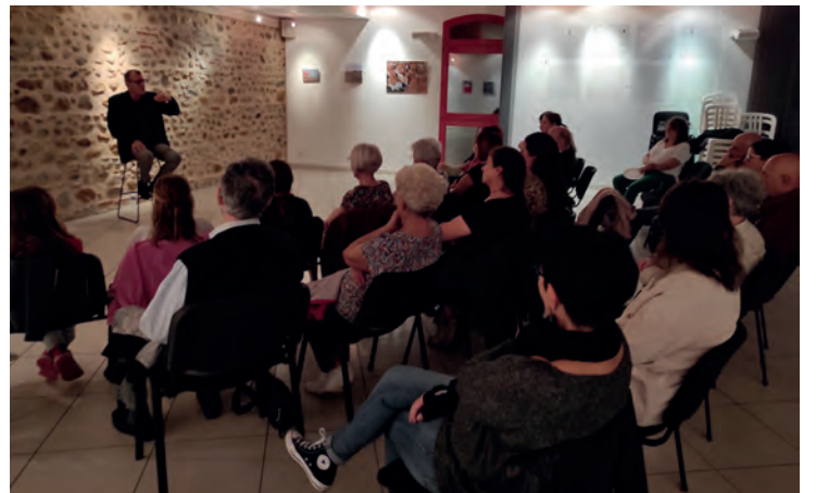
Soirée conte des rendez-vous culturels