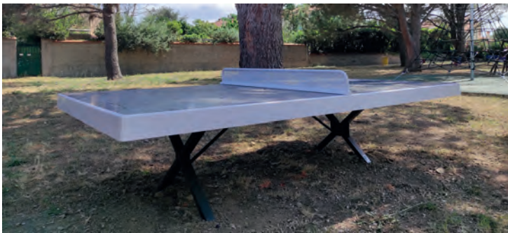
Installation d'une table de ping-pong aire de jeux des enfants.