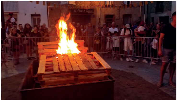
Soirée des feux de la Saint Jean