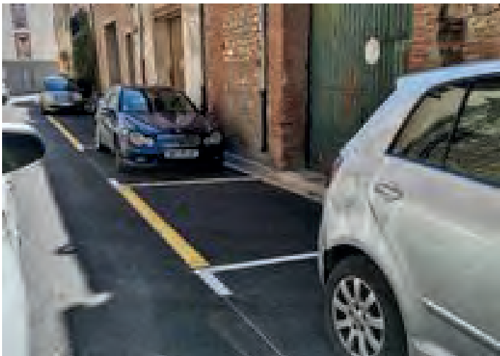
Amenagement de voiries et marquage de zones de stationnement rue des caves