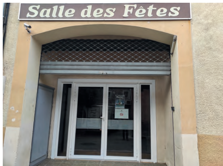
Pose de nouvelles portes et fenêtres à la salle des fêtes