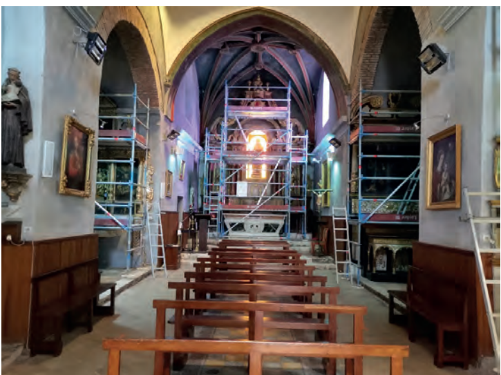
Tranche 2 des travaux de conservation et de restauration de l'église.