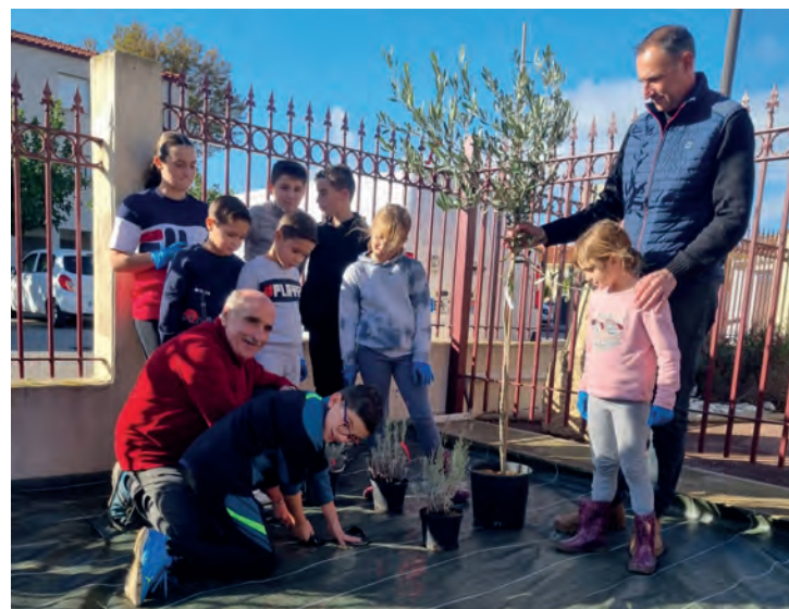
Plantation arbustes, jardin de la mairie.