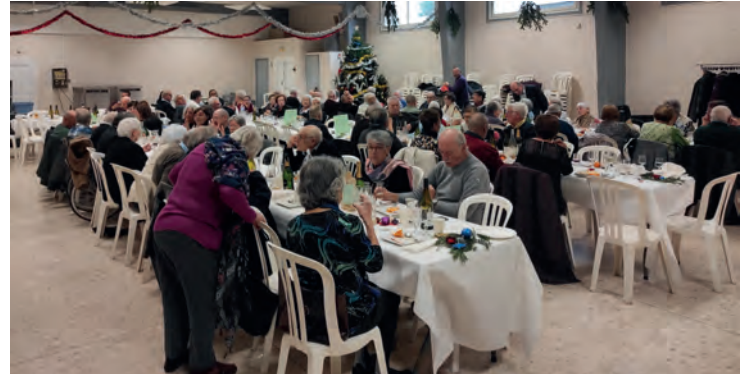
Repas des aînés pour fêter Noël